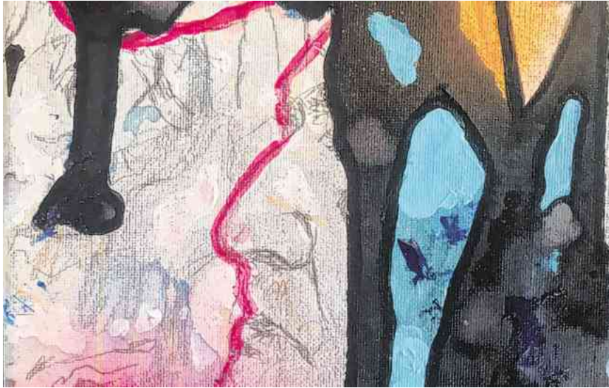
Silvia Sun: „Brahms' secret tears“ 2023