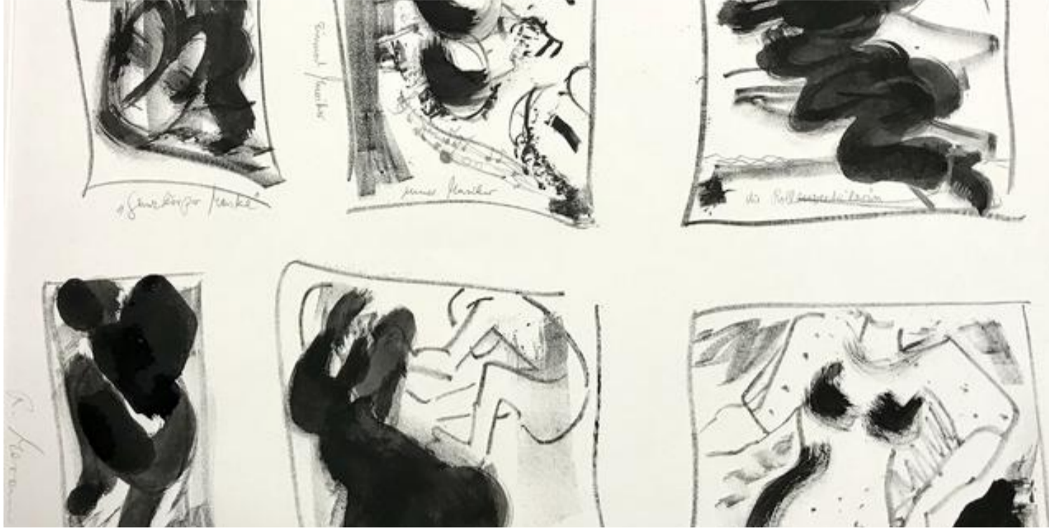
Lebensakrobaten, Mischdurcktechnik/Tusche, 60x80, 2020 • hochgeladen von Gerlinde Laister

26. Februar 2020, 08:54 Uhr • 31× gelesen • 0 • 0 •