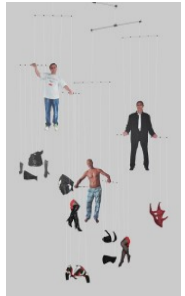
HuM-ART / Gender Poles