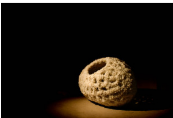
Adriana Torres Topaga / Anfängerin werden

Die aus Kolumbien stammende Künstlerin zeigt Arbeiten zum Thema Sinnes-wahrnehmung, der Körper und sein Bezug zum öffentlichen Raum.