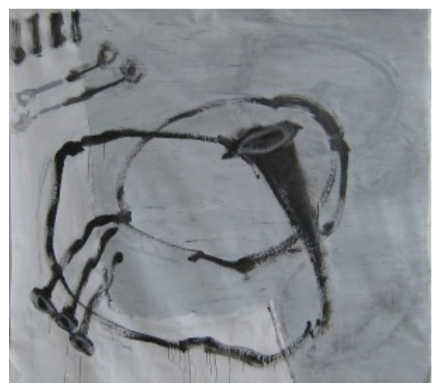
Elfe Koplinger / Die Hörrohre der Königin