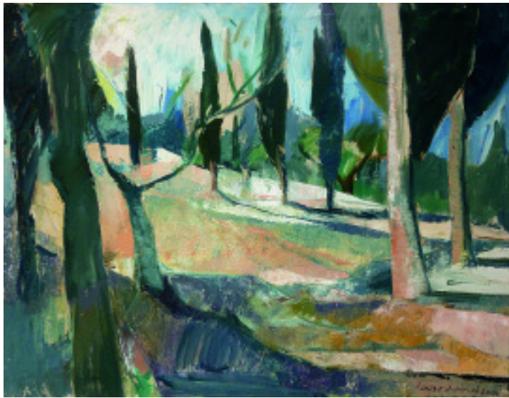
Leohnard Lehmann: „Betende Bäume“ 2000, Öl auf Leinwand, 70 x 90 cm; rechte Seite: „Am Meer“ 2010, Öl auf Leinwand, 65 x 95 cm.