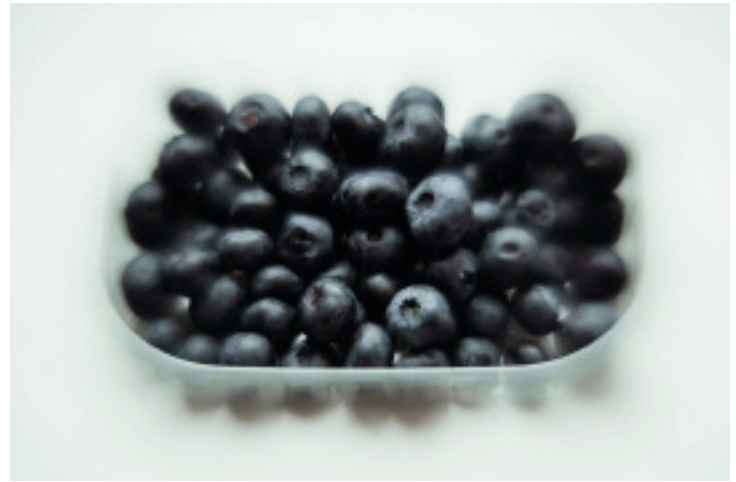
Eckart Sonneleitner: „Bilder aus der Heimat: Heidelbeeren“ 2010, Foto, Inkjet auf Papier, 61 x 87cm; linke Seite: „Gesicht“ 2006, Tusche auf Leinwand, 120 x 80 cm.