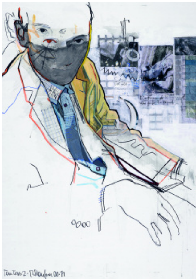
Martin Stauffner: „Tom Tom 2“ 2000, Mischtechnik auf Papier, 60 x 80 cm; rechte Seite: „Poetry in Motion - Paris 12, Rimbaud“ 2010, Mischtechnik auf Papier, 60 x 80 cm.