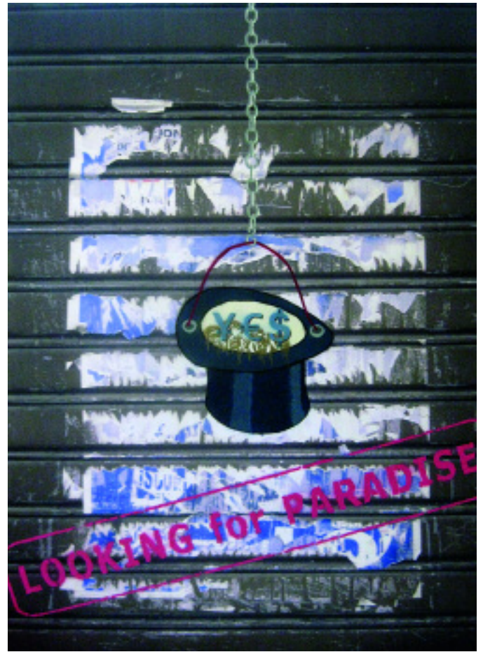
Helga Schager: „Ablaufdatum“ 2003, Mischtechnik auf Hartfaserplatte, 102,5 x 155 cm; rechte Seite: „Yes or No“ 2010, Mischtechnik auf Sperrholz, 90 x 126 cm.