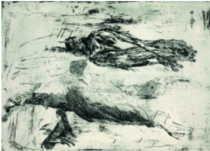
Therese Eisenmann: „Finale di Sabiona“ 2005, Kaltnadelradierung, 50 x 72 cm; rechte Seite: „Donna W.“ 2010, Stahlgravur, 74,5 x 45 cm.