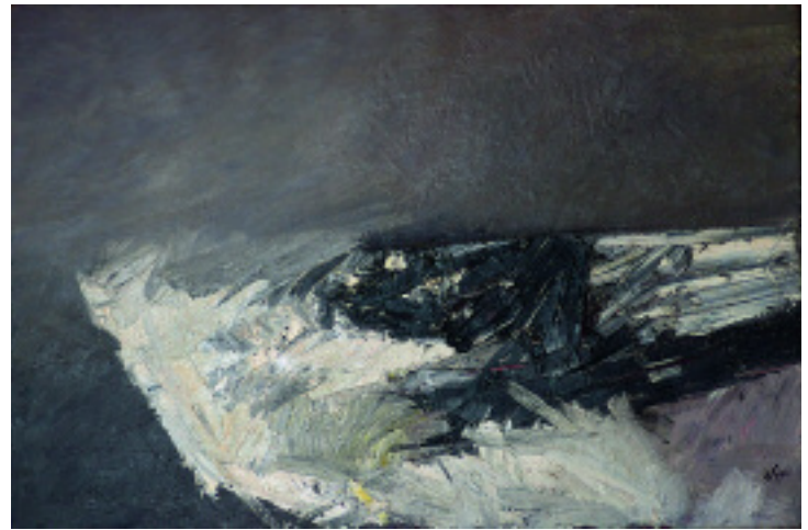
Wolfgang Hemelmayr: „Rotes Mädchen“ 1997, Kreide auf Papier, 70 x 100 cm; rechte Seite: „Landstück“ 2004, Öl auf Leinwand, 80 x 120 cm.