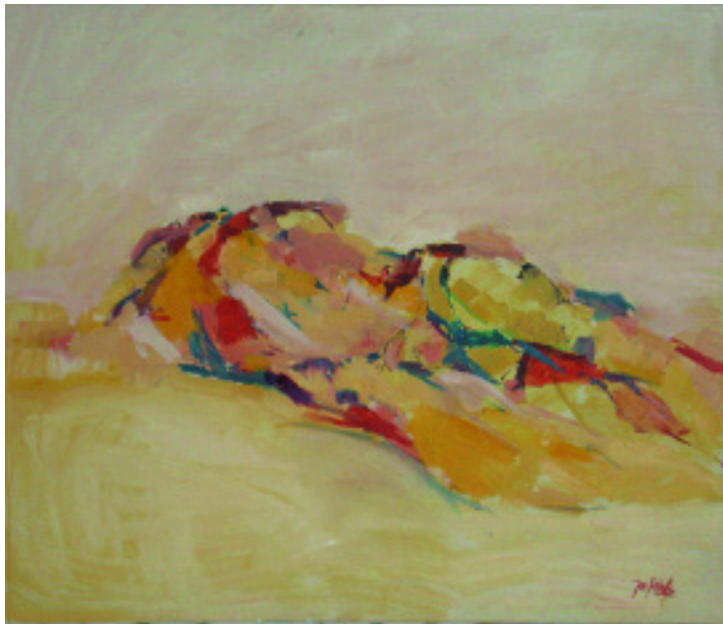
Judith Goetzloff: „Männlicher Akt“ 2005, Öl auf Leinwand, 110 x 120 cm; rechte Seite: „Alkoven“ 2008, Öl auf Leinwand, 100 x 150 cm.